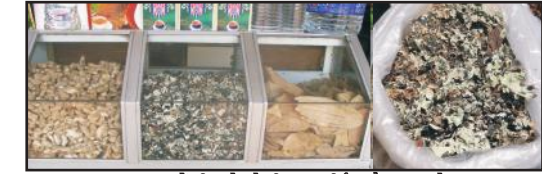
बाजार में बिकने के लिए प्रदर्शित शैक मसाले