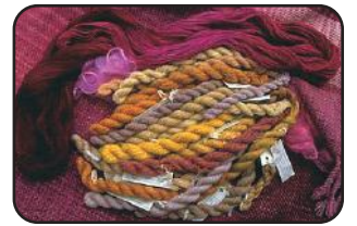
शैक रंगों द्वारा रंगा ऊन