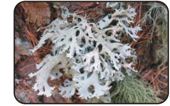
स्यूडइवरनिया धूरधूरसीया सुगंध उद्योग में उपयोग में लाया जाने वाला शैक

उत्तर प्रदेश के कन्नौज जिले में बड़ी मात्रा में हिमालय क्षेत्र से शैकों को एकत्रित कर उनसे 'हिना अत्तर' नामक सुगन्धित इत्र बनाया जाता है। शैकों को पानी में उबाल कर वाष्प को चंदन के तेल में प्रवाहित कर हिना अत्तर नामक इत्र तैय्यार होता है।